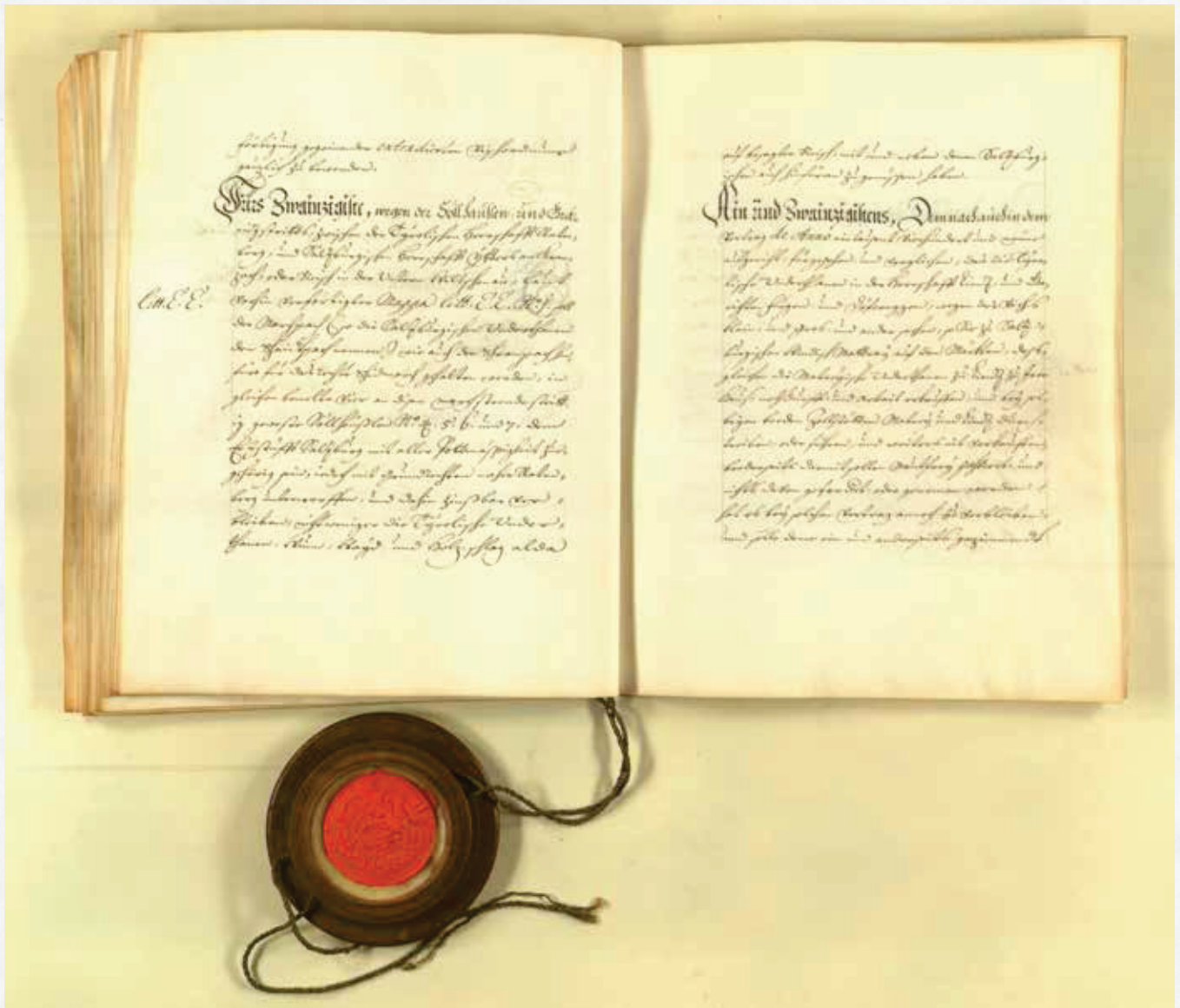
Der salzburgisch-tirolische Grenzvertrag von 1690 in der Ausfertigung von 1699 mit dem Siegel des Kaisers Leopold I.