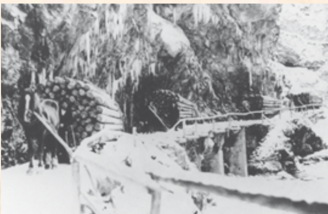
Fünf Schlitten, gezogen jeweils nur von einem Pferd, befördern im Winter 1932/33 große Mengen Rundholz durch die Klamm nach Kundl. Es wurde im Konvoi zu festgelegten Zeiten gefahren, da über weite Strecken keine Ausweichmöglichkeit bestand.