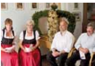
Erntedankfeier im Altenwohnheim