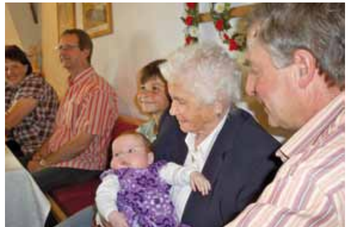
Zu deinem 100. Geburtstag noch alles Gute und viel Gesundheit.