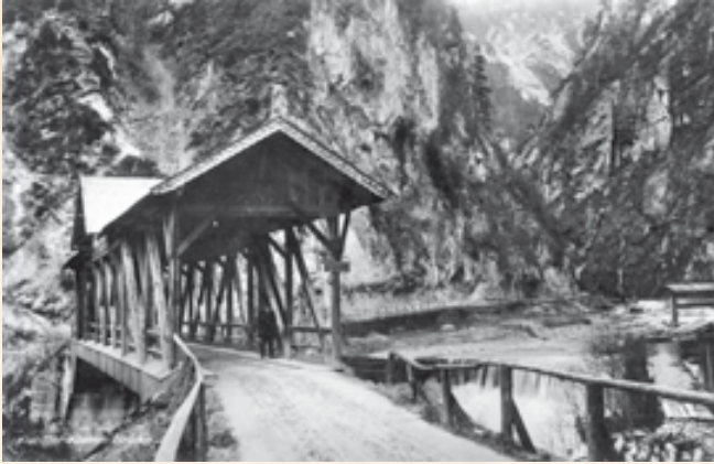
Die erst am 2. Dezember 1914 fertig gestellte, große gezimmerte Holzbrücke am Eingang der Straße in Kundl. Sie steht heute unter Denkmalschutz.