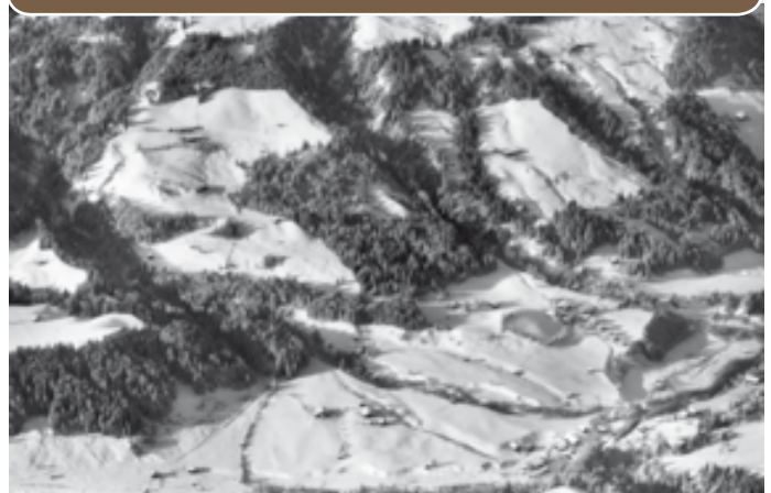
Flugaufnahme Mühlthal/Thierbach, ca. 1964