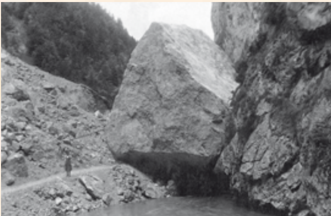
Im Frühjahr 1929 stürzte ein riesiger Felsbrocken im Ausmaß von 280 Kubikmeter beim Steinertalbach in die Ache. Er musste einige Jahre später in Etappen gesprengt werden, um die Gefahr eines Wasserstaus und eine anschließende Überschwemmung auszuschalten.