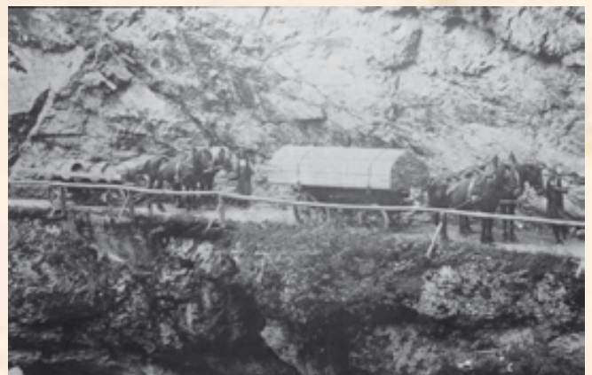
Ein Transport mit Fässern und Brettern auf dem Weg nach Kundl. Anders als im Winter bei den Schlitten waren in der schneefreien Zeit trotz geringerer Ladung jeweils zwei Pferde zum Ziehen der Wagen notwendig.