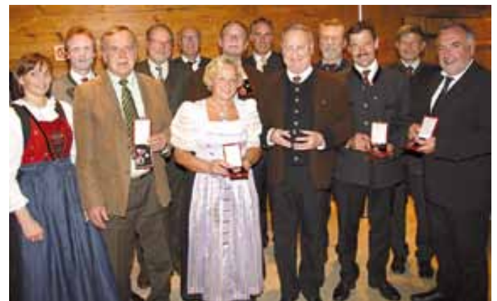
Im Bild die Geehrten.