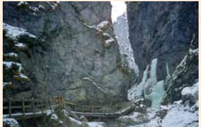
Immer wieder zerstörten Unwetter größere Teile der Straße. Man behelft sich mit provisorischen Instandsetzungen.