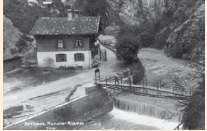
Das Maut- oder Zollhaus in seiner ursprünglichen Form. Die Durchfahrt für Fuhrwerke ist offen, das Gitter für Fußgänger aber geschlossen.