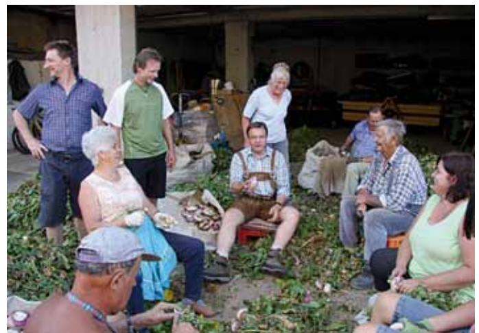
LH Günther Platter versucht sich beim Ruabm abhappeln

Zu eurer Erinnerung unsere Öffnungszeiten in der neuen Volksschule in Niederau: Dienstag: 16.00 bis 17.30 Uhr und Freitag: 18.30 bis 20.00 Uhr.