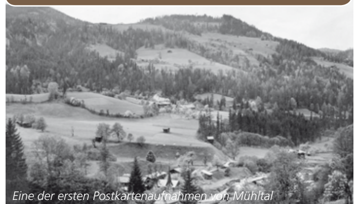
Eine der ersten Postkartenaufnahmen von Mühtal