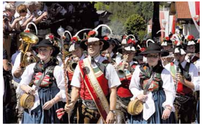
Gerngesehene Gäste, die BMK aus Alpbach