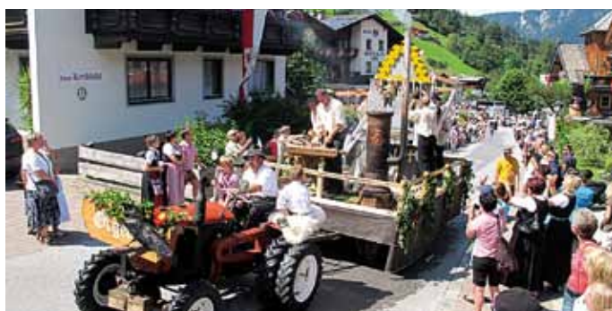
Festwagen „Die Orgelbauer“