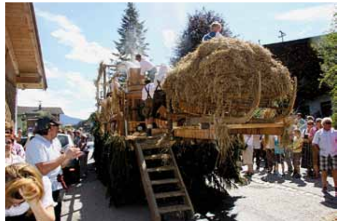
Eine „Dreschtenne“ als Festwagen