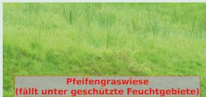
Pfeifengraswiese (fällt unter geschützte Feuchtgebiete)