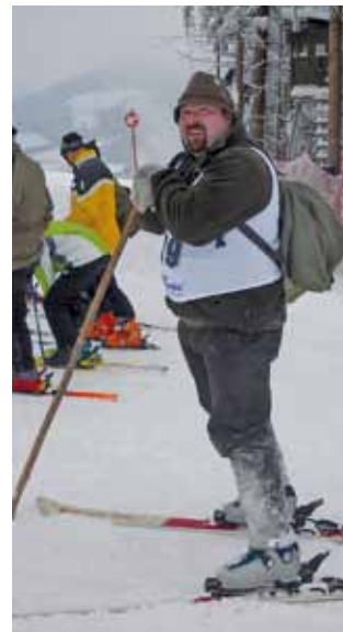
Ein rennfahrender Jäger

Am 22. Jänner 2011 fand in Auffach in der Wildschönau bereits zum drittenmal der Kufsteiner Bezirksjägerschitag statt. Bei tiefwinterlicher Witterung, aber besten Pistenverhältnissen wurden wieder die schnellsten Schifahrer unter den Jägerinnen und Jägern des Bezirkes ermittelt.