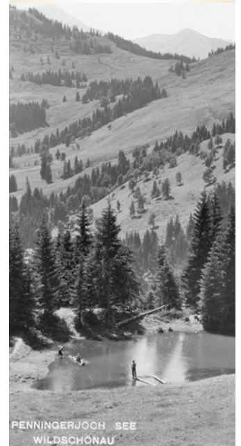
PENNINGERJOCH SEE WILDSCHÖNAU

HEIZUNG • SOLAR • WÄRMEPUMPEN • PHOTOVOLTAIK G. Gföller • Mobil 0664/2560195 • Tel. 05339/8096