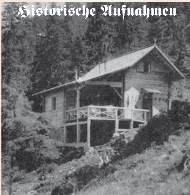
Jagdhütte Schönanger, Oberau bei Wörgl, Tirol

Historische Postkarte der Jagdhütte Schönanger