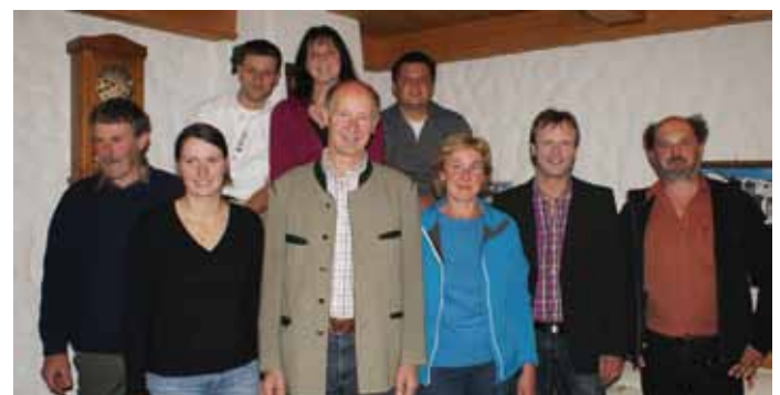
...auch in Oberau wurde lange Theater gespielt