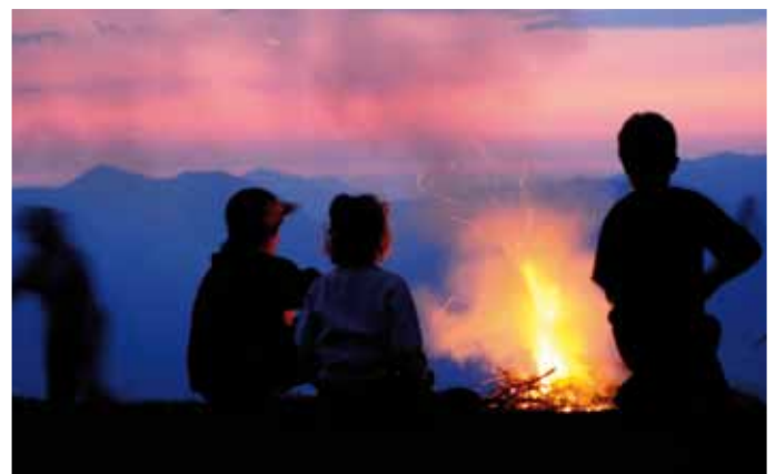
19. Juni – Markbachjoch Sonnwendfeier "Der Berg ruft"

Um Beachtung wird gebeten. www.wildschoenau.gv.at/aktuelles