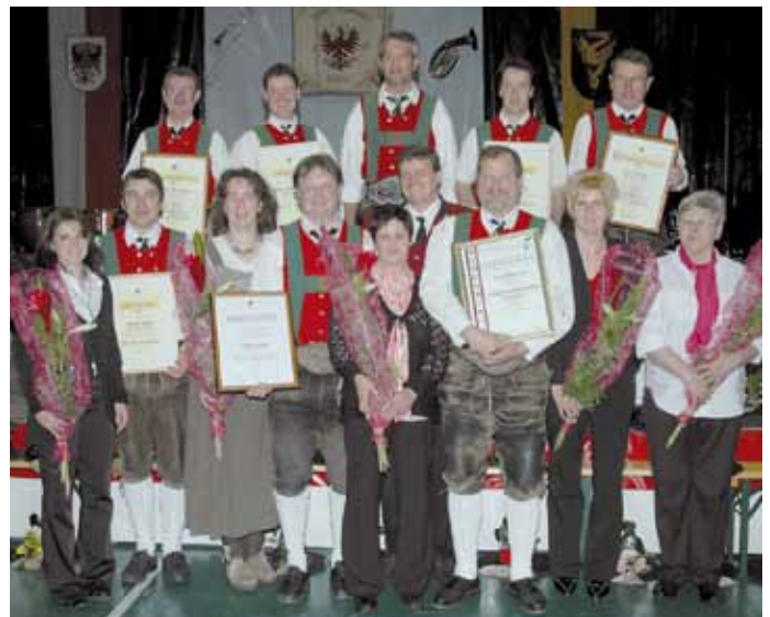
Die Geehrten mit ihren Gattinnen und den Ehrengästen