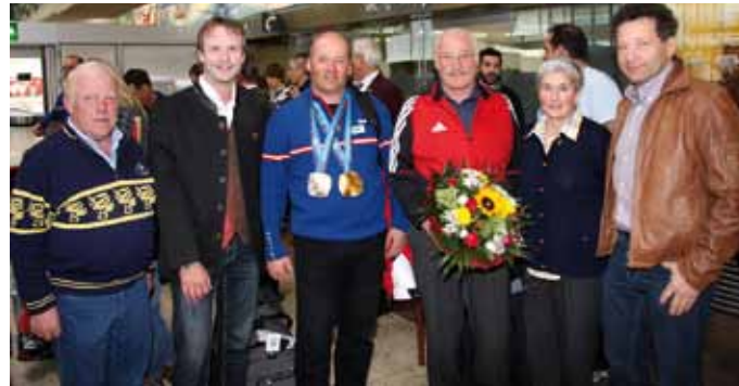
Schoner Stefan beim Empfang in Innsbruck.

Es sind schon wieder zwei Monate vergangen seit ich als Blinden Guide mit einer Gold- und Silbermedaille von den Paralympics in Vancouver heim kehren konnte.