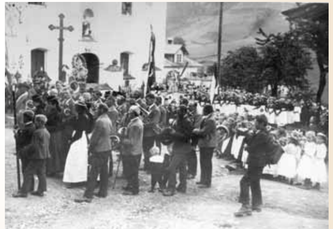
Prozession in Oberau