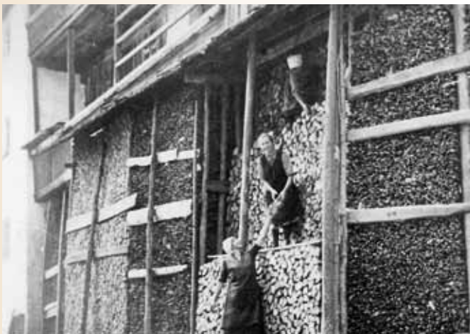
Holzrichten beim Kellerwirt