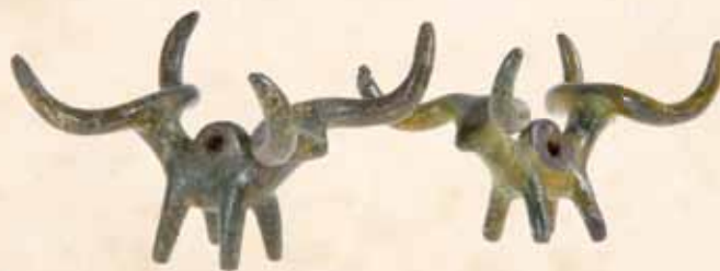
Abbildung in annähernd natürlicher Größe