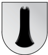
Brixen im Thale